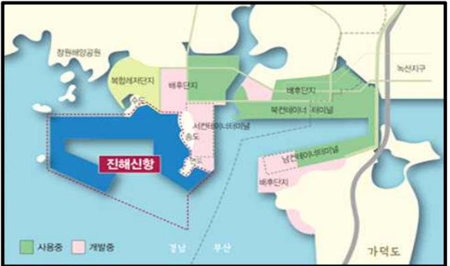
▲ 진해신항 조감도

아울러 항만건설 분야에서 순환골재가 좀 더 다양한 용도로 사용될 수 있도록 순환골재 및 순환골재 재활용제품 활용이 가능한 공사의 종류를 정립하고, 공종별 품질기준 수립 및 품질확보방안을 마련하기 위해 연구용역을 추진하는 등 순환골재 사용 활성화를 위해 부단한 노력을 기울이고 있습니다.