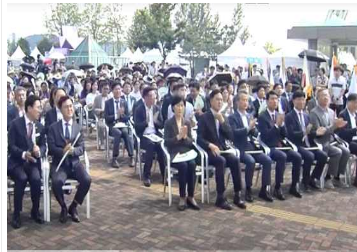
▲ 자원순환의 날 기념식 참석 내빈