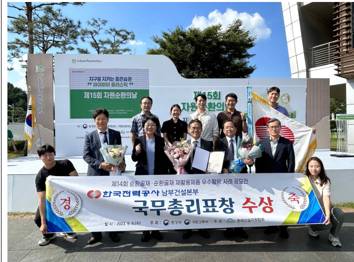
▲ 한국전력공사 남부건설본부(국무총리 표창)