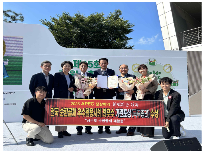
▲ 경주시 맑은물사업본부(국무총리 표창)