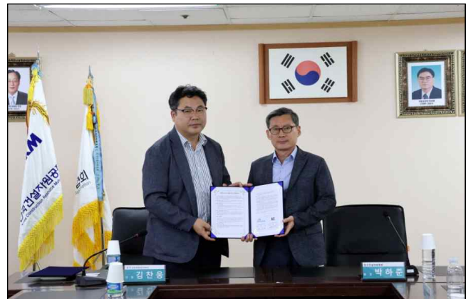
<협약서 서명자 기념촬영>