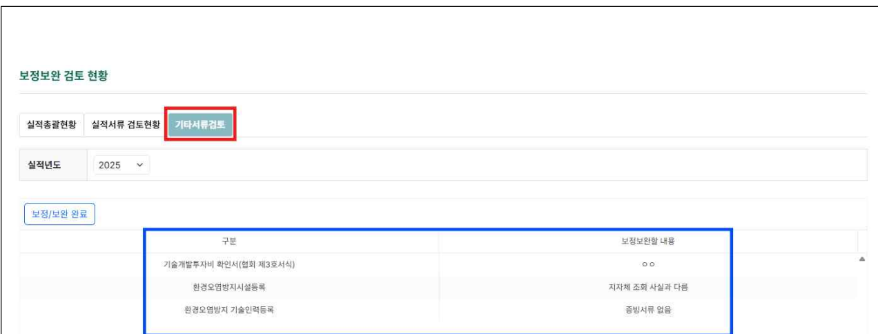
5. 기타서류 보정 내용 확인