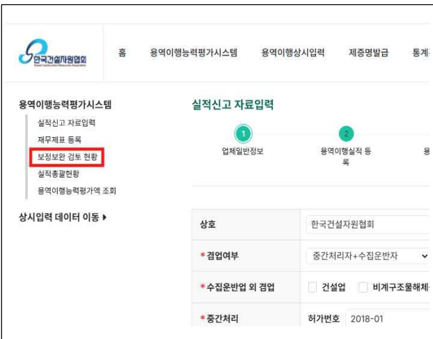
3. 보정보안 검토 현황 클릭