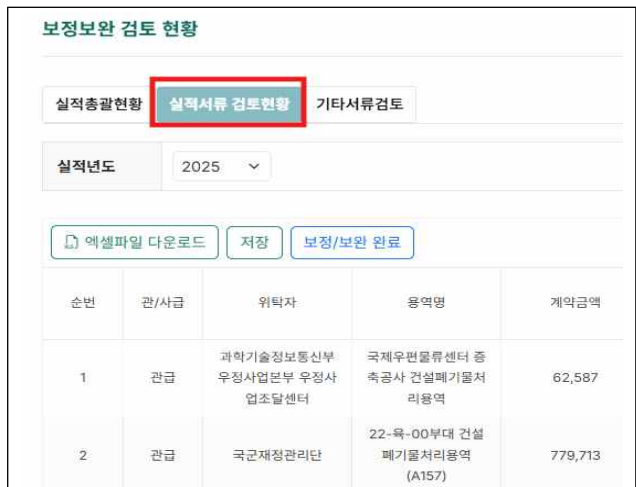
4. 실적서류 검토현황 확인 및 수정