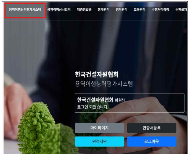
2. 용역이행능력평가시스템 클릭